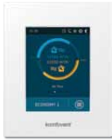
пульт управления C5.1