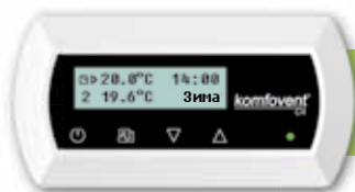
пульт управления C4