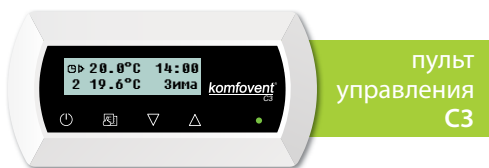
пульт управления C3