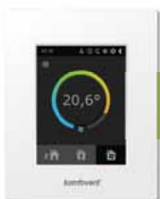
пульт управления C4.1